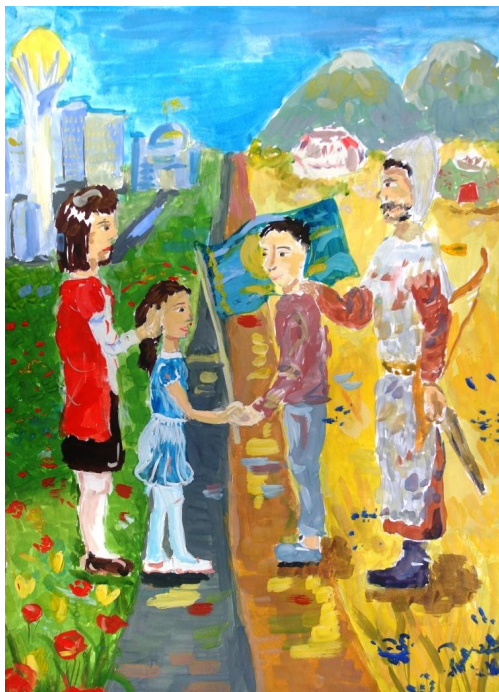
Рисунок Тектургановой Жanelь, 8 «А»